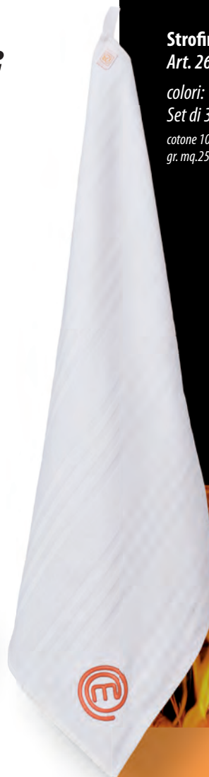
Strofinaccio cuoco Art. 26SE0211

colori: ● Set di 3 pezzi cotone 100% gr. mq.250