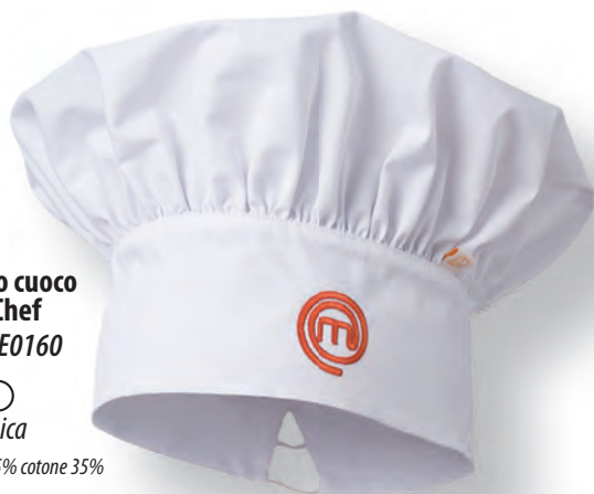
Berretto cuoco MasterChef Art. 26BE0160