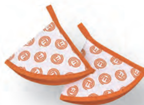
Tovaglietta MasterChef Art. 26T00039