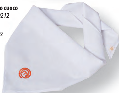
Fazzoletto cuoco Art. 26SE0212