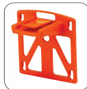
SUPPORTO A MURO INCLUSO